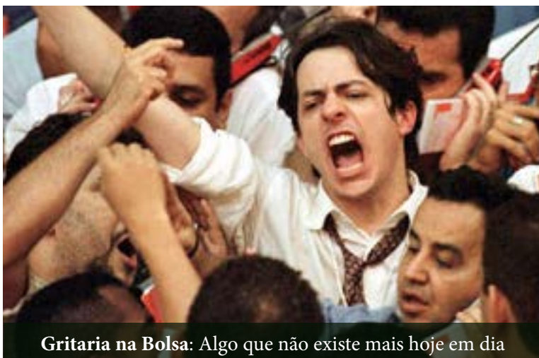
Gritaria na Bolsa: Algo que não existe mais hoje em dia

Sabe aquela gritaria que você se lembra quando falamos em bolsa de valores? Aquilo não existe mais.